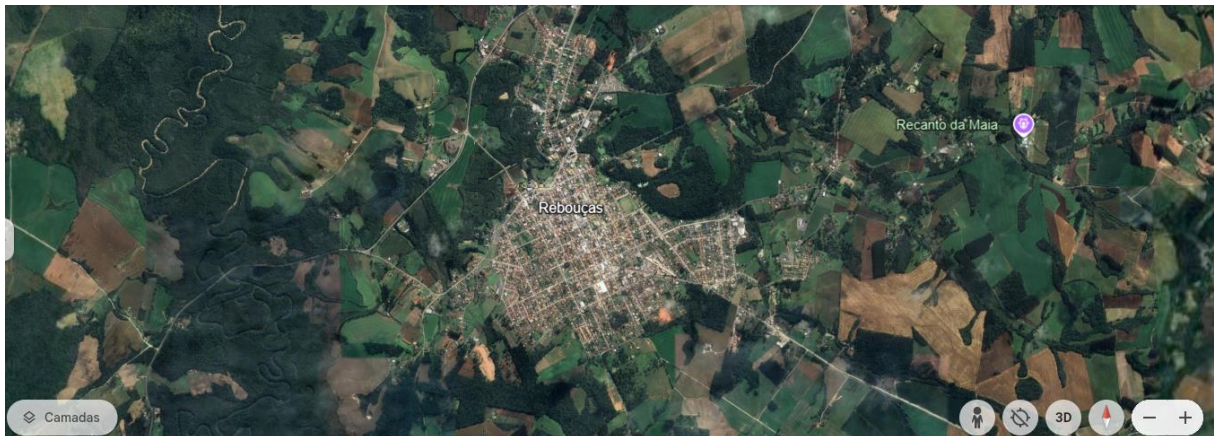
Figura 2- Mapa da área geográfica urbana e rural. Rebouças, 2024.

A territorialização faz parte da construção social da APS, conhecer o território sanitário faz parte do planejamento da equipe. A territorialização faz parte do macroprocesso da atenção primária, esse que foi trabalhado nos anteriores por meio do planificaSUS mediante a assinatura do triênio da parceria da SESA com o hospital Albert Einstein, para que todas as cidades da 4ª RS saúde aderissem a capacitação (MENDES, 2025).