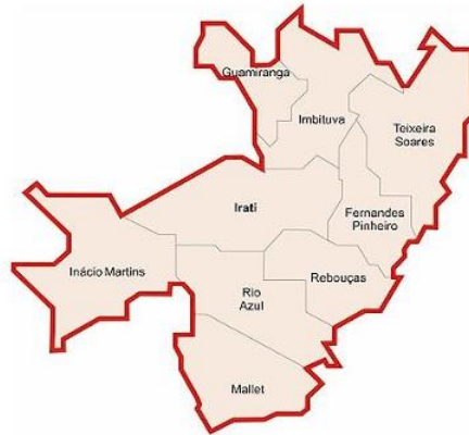
Figura 1: MAPA COM A IDENTIFICAÇÃO DA LOCALIZAÇÃO DO MUNICÍPIO DE REBOUÇAS PR NA 4ª REGIONAL DE SAÚDE