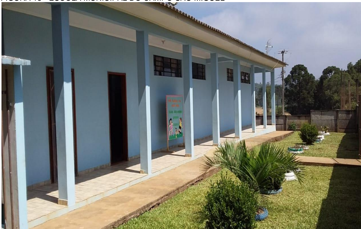
FIGURA 15 - ESCOLA MUNICIPAL DO CAMPO SÃO MIGUEL