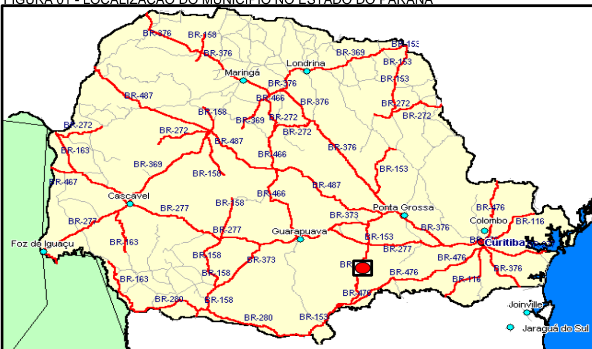
FIGURA 01 - LOCALIZAÇÃO DO MUNICÍPIO NO ESTADO DO PARANÁ

Rebouças situa-se na Região Centro-Sul do Estado do Paraná, a uma distância de 167,87 km da capital do Estado, possuindo uma área territorial de 482,065 km 2 , no cruzamento do paralelo 25°37'14" Sul com o meridiano 50°41'34" Oeste, a uma altitude de 778 metros.