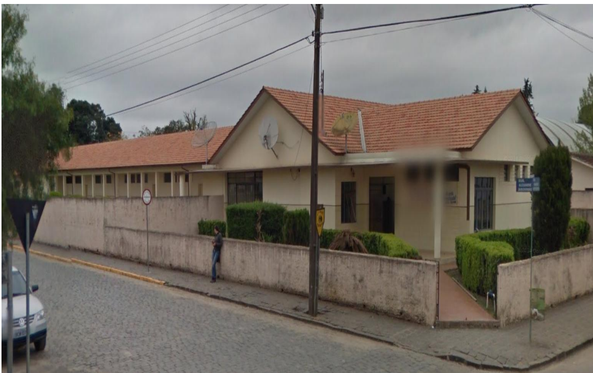
FIGURA 16 - COLÉGIO ESTADUAL PROFESSORA MARIA IGNACIA- ENSINO FUNDAMENTAL ANOS FINAIS

FONTE: Plano Municipal de Educação (2020)