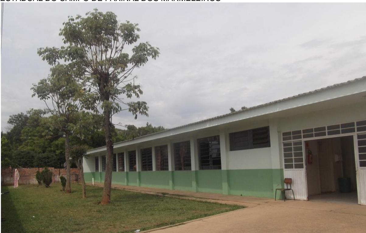
FIGURA 09 -ESCOLA MUNICIPAL DO CAMPO PROFESSOR LEONARDO KRUL E COLÉGIO ESTADUAL DO CAMPO DE FAXINAL DOS MARMELEIROS