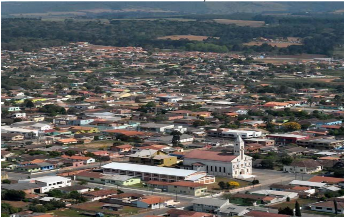
FIGURA 04 - VISTA PARCIAL DO MUNICÍPIO DE REBOUÇAS