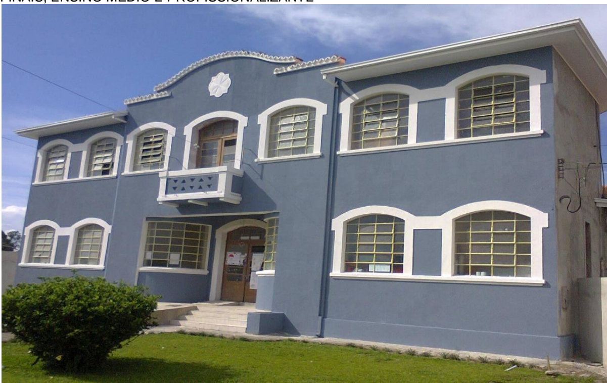
FIGURA 17 - COLÉGIO ESTADUAL PROFESSOR JÚLIO CÉSAR - ENSINO FUNDAMENTAL ANOS FINAIS, ENSINO MÉDIO E PROFISSIONALIZANTE