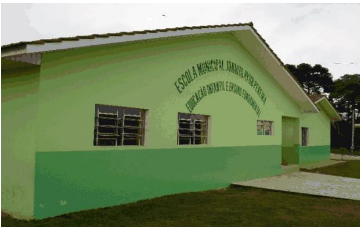
FIGURA 09 - ESCOLA MUNICIPAL JOANITA AYUB PEREIRA