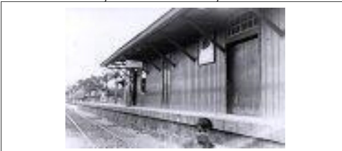
FIGURA 03 - FOTO DA ESTAÇÃO FERROVIÁRIA DE REBOUÇAS EM 1940

Company, inaugurada em primeiro de janeiro de 1.900.