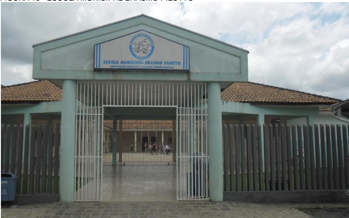
FIGURA 13 - ESCOLA MUNICIPAL ERASMO PILOTTO