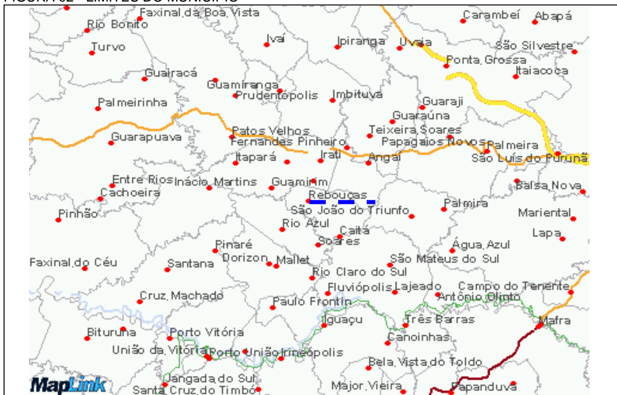
FIGURA 02 - LIMITES DO MUNICÍPIO