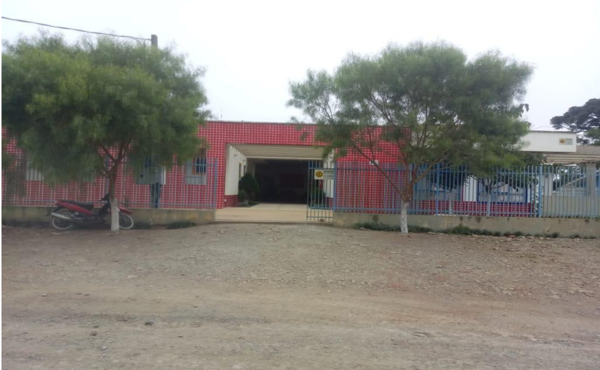
FIGURA 06 – CMEI TEREZINHA WASIK DE LARA, 2020